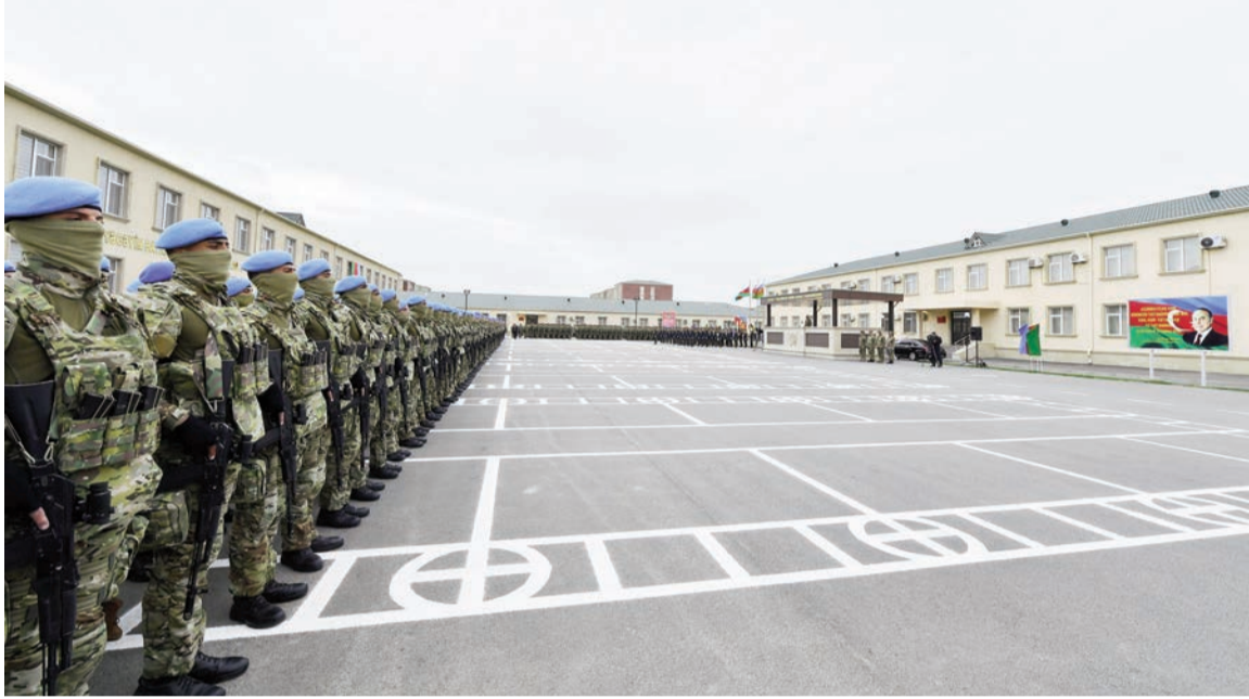
(Əvvəli 3-cü səhifədə)

Bu gün isə bölgəmizdə vəziyyət tam fərqlidir. Biz qalib xalq kimi, müzəffər ölkə kimi öz gücümüzü artırırıq. Xüsusi təyinatlıların gələcək fəaliyyəti ilə bağlı bütün göstərişlər verilmişdir. Bu hərbi hissədə mən müharibədən bir il qabaq olmuşdum, xüsusi təyinatlılarla görüşmüşdüm. Bu gün də, bu bayram günündə sizinlə birlikdə olmaq mənim üçün böyük şərəfdir. Mən sizinlə fəxr edirəm. Bütün Azərbaycan xalqı sizinlə fəxr edir. Ermənistan, Ermənistan silahlı qüvvələri Azərbaycan xüsusi təyinatlılarının adı gələndə titrəməyə başlayırlar. Onların canlarında olan bu xof bu günə qədər çıxmayıb və çıxmıyacaq. Biz müharibə istəmirik. Biz istədiyimizə nail olduq. Tarixi ədaləti bərpa etdik. Xalq qarşısında, tarix qarşısında, gələcək nəsillər qarşısında öz vətəndaşlıq borcumuzu şərəflə yerinə yetirdik. Ancaq biz hər zaman ayıq olmalıyıq. Çünki Ermənistanda bu gün də revanşist qüvvələr baş qaldırır. Ermənistanda bu gün də Azərbaycana qarşı ərazi iddiaları ilə çıxış edənlər var. Biz bunu daim diqqət mərkəzində saxlamalıyıq, buna laqeyd olma-