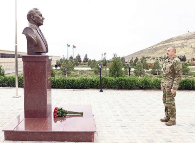
(Əvvəli 1-ci səhifədə)

Azərbaycan Silahlı Qüvvələrinin tarixi Zəfəri bizim tariximizdə əbədi qalacaq. Biz müzəffər xalq kimi, qalib dövlət kimi bundan sonra əbədi yaşayacağıq. Bu sevinci bizə bəxş edən bizim övladlarımız, əsgər və zabitlərimiz olub. Bütün Silahlı Qüvvələr bu Qələbənin əldə olunmasında öz dəyərli töhfəsini vermişdir və cəmi 44 gün ərzində tarixi Zəfər əldə olundu, düşmən bizim qabağımızda diz çökdü və məcbur oldu öz əli ilə kapitulyasiya aktına imza atdı. Bu, tariximizin və mənim həyatımda bəlkə də ən yaddaqalan, ən sevincli, ən qürurlu anlardan biridir, bəlkə