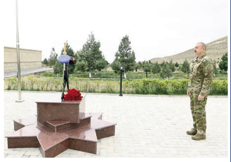
tankla silahlanmış ermənilər sizin qarşınızda aciz idilər.

qalacaq. Müharibənin ilk günündən son gününə qədər hədəfimiz Şuşanın, bizim Qarabağımızın tacı olan əziz şəhərimizin erməni tapdağından azad olunması idi və buna nail olduq, buna siz nail oldunuz, xüsusi təyinatlılar nail oldu. Neçə gün yorulmadan, əlində yüngül silahlarla o dərələrdən, meşələrdən keçərək Şuşaya yaxınlaşdı bizim igidlərimiz. Yol boyunca bir çox kəndi azad etdi, qan tökdü, şəhidlər verdi, amma dayanmadı, irəliyə gəldi. Bu gün Şuşaya gələn hər bir insan, sadəcə olaraq, məttəl qalır - bu alınmaz qalanı Azərbaycan övladları necə aldılar. Hər dəfə Şuşaya Zəfər yolu ilə gedəndə hər bir insan bu haqda fikirləşir. Son