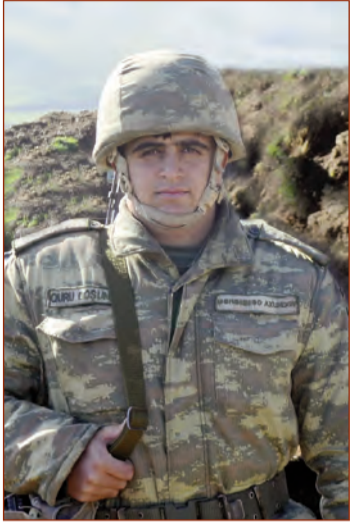
(Əvvəli 4-cü səhifədə)