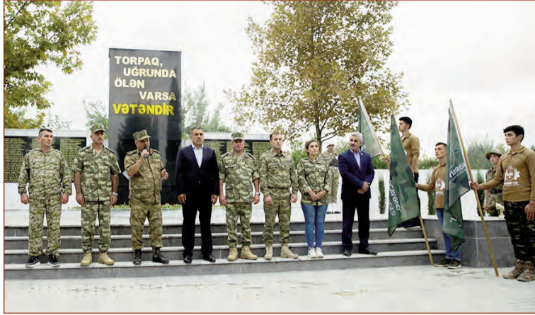
(Əvvəli 4-cü səhifədə)

Yeni nəsil silahları, döyüş texnikaları, optik cihazlar və digər hərbi təyinatlı avadanlıqların nümayiş olunduğu sərgidə 100-dən çox döyüş texnikaları, pilot-suz uçuş aparatları, hava hücumundan müdafiə vasitələri, artilleriya silah və texnikaları, mühəndis silahlandırma vasitələri, rabitə avadanlıqları, tibb təxliyə zirehli avtomobilləri, silah və cihazları nümayiş olunub.