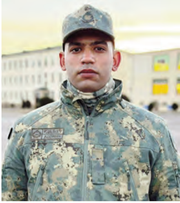
(Əvvəli 6-cı səhifədə)

Validəymlərimin bu gün məni əsgər formasında görməsi mənim üçün böyük fəxr idi. Onların mənə olan inamını doğrultmaq istəyirəm. Əminəm ki, hər bir Azərbaycan genci kimi, mən də Vətənə layiqincə xidmət etməyə borcluyam və bu borcu şərəflə yerinə yetirmək üçün bütün gücümü sərf edəcəyəm.