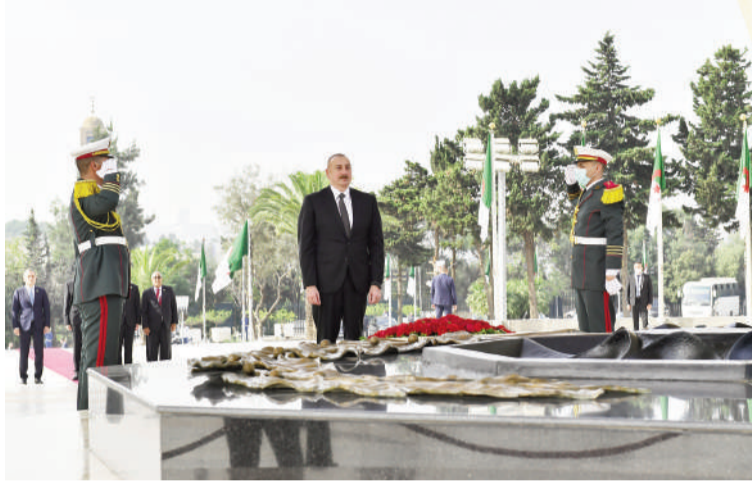
(Əvvəli 1-ci səhifədə)

Hörmətli həmkarlar, xatırlayırınsızsa, pandemiyanın əvvəlində peyvəndlərə çıxış ən vacib məsələlərdən biri idi. Hətta inkişaf etmiş bəzi Qərb ölkələri vaxsınları lazım olduqundan beş dəfə, on dəfə çox əldə edirdilər. Amma resursları olmayan ölkələr əziyyət çəkməyə məcbur idi. Beləliklə, Azərbaycan bu məsələdə bir daha peyvənd millətçiliyinə, peyvəndlərin ədalətsiz paylanılmasına qarşı öz səsinə ucaldı və bu, Qoşulmama Hərəkatının da bizim mövqeyimizə dəstəyini gücləndirdi. Biz gələn ilin martında Qoşulmama Hərəkatının Sammitini keçirməyi planlaşdırırıq. Bu fürsətdən istifadə edib Ərəb Dövlətləri Liqasına üzv olan dövlət və hökumət başçıları həmin Sammitdə iştirak etməyə dəvət edirəm.