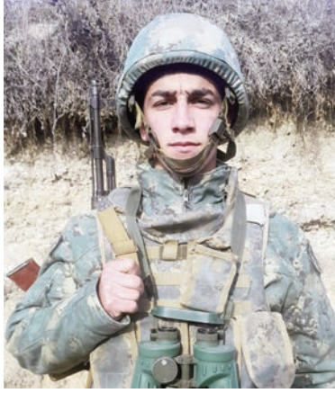
(Əvvəli 6-cı səhifədə)