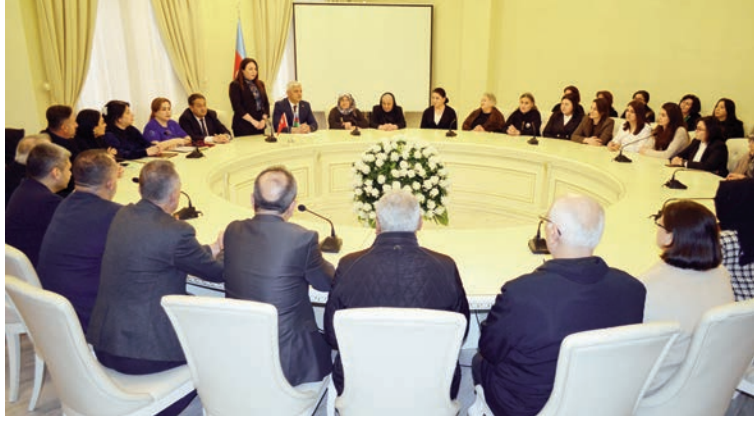
(Övvəli 4-cü səhifədə)

Müdafiə Nazirliyinin nümayəndəsi çıxışında qeyd edib ki, bu gün ölkələrimiz və xalqlarımız arasında olan münasibətlər dostluğun, qardaşlığın nümunəsi, etalonu kimi dəyərləndirilir. Son dövrlərdə baş verən olaylar - 2020-ci il sentyabrın 27-də başlayıb noyabrın 10-da böyük Zəfərlə yekunlaşan Vətən müharibəsi, işğaldan azad olunmuş ərazilərdə ölkəmizin postmüharibə mərhələsində start verdiyi bərpa işləri, tarixi Şuşa Bəyannaməsinin imzalanması, həmçinin Türkiyədə baş verən zəlzələ zamanı Azərbaycanla Türkiyənin bir-birinə necə möhkəm tellərlə bağlı olduqlarını bütün dünyaya bir daha göstərdi.