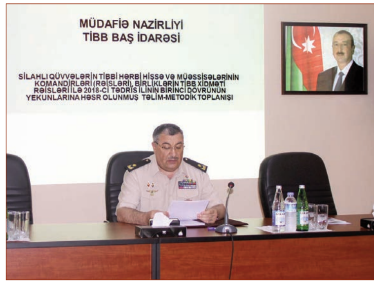
MÜDAFİƏ NAZİRLİYİ TİBB BAŞ İDARƏSİ

SİLAHLI QÜVVƏLƏRİN TİBBİ HƏRBİ HİSSƏ VƏ MÜƏSSİSƏLƏRİNİN KOMANDİRLƏRİ (RƏİSLƏRİ), BİRLİKLƏRİN TİBB XİDMƏTİ RƏİSLƏRİ İLƏ 2018-Cİ TƏDRİS İLİNİN BİRİNCİ DÖVRÜNÜN YEKUNLARINA HƏSR OLUNMUŞ TƏLİM-METODİK TOPLANIŞI