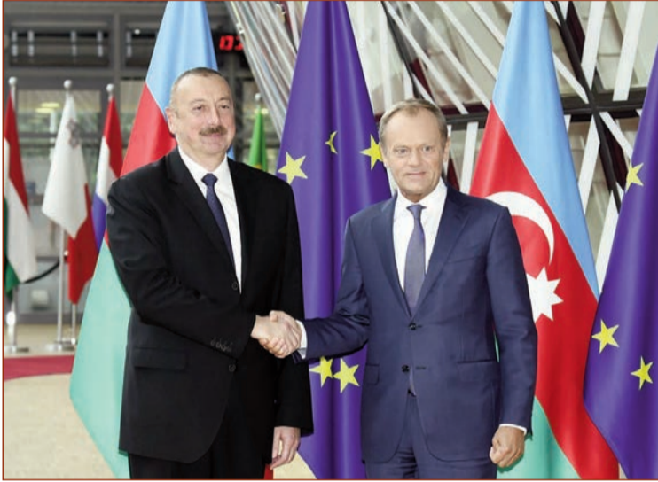
Azərbaycan Respublikasının Prezidenti İlham Əliyev iyulun 11-də Brüsseldə Avropa İttifaqı Şurasının prezidenti Donald Tusk ilə görüşüb.

Görüşdən sonra "Tərəfdaşlıq prioritetləri" sənədinin parafanma mərasimi olub.