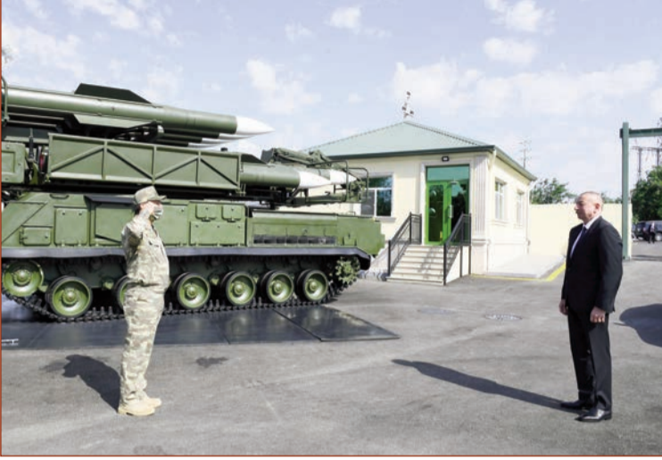
(Əvvəli 1-ci səhifədə)

Bizim ordumuzun son illər ərzində uğurlu inkişafı göz qabağındadır. Bunu Azərbaycan xalqı bilir, görür. Dünyada orduların reytinglərini tərtib edən sanballı qurumlar da bunu qeyd edir. Bu gün Azərbaycan Ordusu dünyada 50 ən güclü ordu sırasındadır. Biz bunu yorulmaz fəaliyyət nəticəsində əldə etmişik. Çünki mənim prezident kimi fəaliyyətimdə ordu quruculuğu birinci yerdədir.