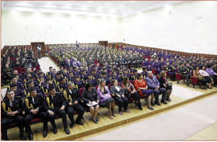
Silahlı Qüvvələrin Təlim və Tədris Mərkəzində "Altı əsrlik mərdlik simvolu - Nəsimi" adlı növbəti tədbir keçirilib.

Azərbaycan Respublikasının Prezidenti, Silahlı Qüvvələrin Ali Baş Komandanı İlham Əliyevin sərəncamının icrasının təmin edilməsi məqsədilə Müdafiə nazirinin təsdiq etdiyi tədbirlər planına əsasən, Azərbaycan Ordusunda İmadəddin Nəsiminin 650 illik yubileyinə həsr olunmuş silsilə mədəni-kültüvi tədbirlər keçirilir.