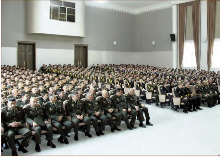
Müdafiə Nazirliyi Mətbuat Xidmətinin məlumatına əsasən, görüşün əhəmiyyəti barədə iştirakçılara məlumat verən

Ulu öndər Heydər Əliyevin anadan olmasının 96-cı ildönümü və Azərbaycan Ali Hərbi Məktəbinə xalqımızın Ümummilli Liderinin adının verilməsinin 15-ci ildönümü münasibətilə hərbi təhsil ocağında "Heydər Əliyev və ordu quruculuğu" mövzusunda tədbir keçirilib.