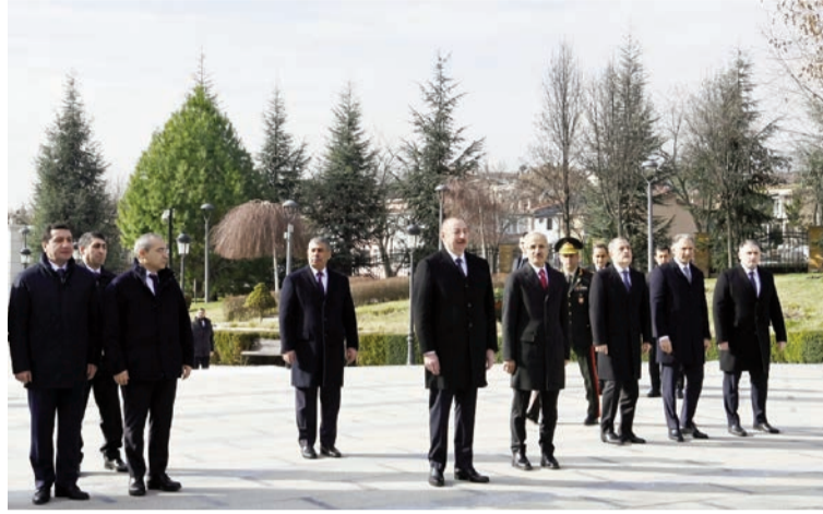
(Əvvəli 2-ci səhifədə)

Kritik meydan oxumaların yaşandığı bir dövrdə ölkələrimizin nəqliyyat və enerji sahələrindəki potensialını inkişaf etdirməli olduğumuz aşkardır. Bakı-Tbilisi-Qars dəmir yolu xətti əsasən bunun ən konkret nümunələrindəndir. Bu xətdən ən yüksək səmərə götürmək üçün bərpa işləri sürətlə başa çatdırılmalıdır.