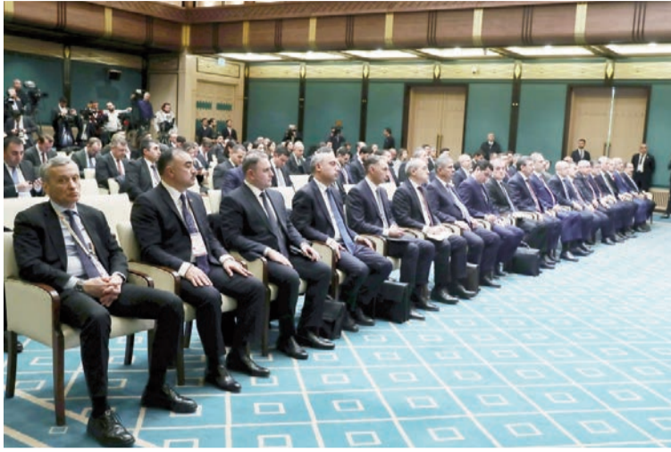
(Əvvəli 3-cü səhifədə)

Keçən il Azərbaycandan Türkiyəyə 9 milyard kubmetr təbii qaz ixrac edilmişdir. Əldə edilmiş razılışmalar əsasında qazın həcminin artırılması nəzərdə tutulur, o cümlədən Türkiyə ərazisindən Avropaya gedən təbii qaz qitənin bir çox ölkələri üçün önəmli enerji təhlükəsizliyi məsələsidir.