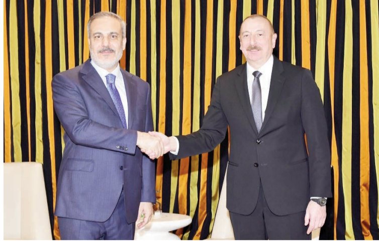
(Əvvəli 4-cü səhifədə)

Həmçinin Azərbaycan-Ermənistan münasibətləri, sülh sazişi ilə bağlı danışıqlar və regional təhlükəsizlik məsələləri müzakirə olunub. Qeyd edilib ki, COP29 əsasında Ermənistanla Azərbaycan arasında əldə olunan kompromislər, COP29-un Azərbaycanda keçirilməsi sülh gündəliyinin də irəli aparılması üçün əlverişli imkanlar və şərait yaradır.