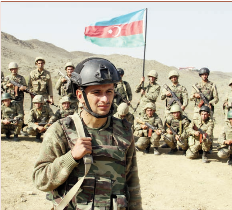
(Əvvəli 1-ci səhifədə)

Azərbaycan əsgəri döyüş-döyüş Böyük Qələbəyə yaxınlaşır. Döyüşlərin qələbə ruhu açılan səhərlərin şükranlıq duasıdır elə bil. Döyüşlərin - döyüşçülərin baxışlarında çırpınan bu ruh min illərin tarixə dediklərinin ifadəsidir: Tarix yazanların qətiyyətinin kəsəri gözəgötürməzlərə həmişə görk olub. Torpaqlarımızı işğaldan Azərbaycan əsgərinin qələbə ruhu, dövlətə sədaqəti, bir də bu görk xilas edir - bu görk Azərbaycan əsgərinin Vətənə sədaqətidir. Bu sədaqət Böyük Qələbənin işığı kimidi - dostun gözlərinin nurunu artırır, qəlbipaxırların gözlərini qamaşdırır!..