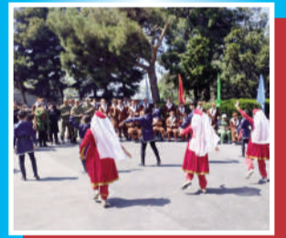
Gəncə Hərbi Hospitalının yaranmasının 30 illiyi qeyd edildi