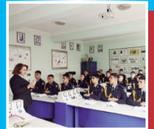
Ulu Öndər Heydər Əliyevin adının əbədiləşdiyi təhsil ocağı