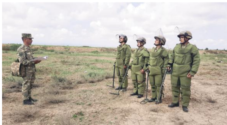
(Əvvəli 1-ci səhifədə)

Sonda hərbi qulluqçular qarşısında hüquqi maarifləndirici məzmunlu çıxışlar olunub, onları maraqlandıran suallar cavablandırılıb, eləcə də hərçilərinin qayğı və problemləri barədə məlumat verilib.