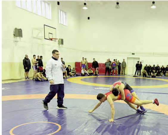
üzrə 10 çəki dərəcəsinə 11 komandadan ümumilikdə 297 idmançı iştirak edir.