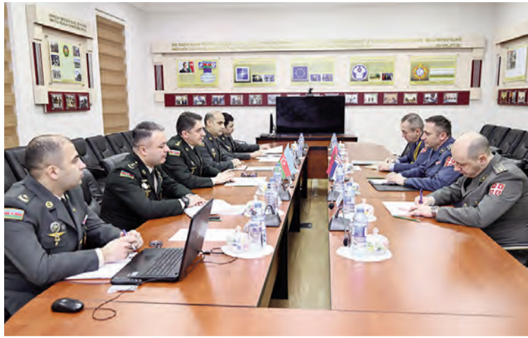
Azərbaycan və Serbiya Müdafiə nazirlikləri nümayəndələrinin iştirakı ilə "İkitərəfli hərbi əməkdaşlıq danışıqları" keçirilib.