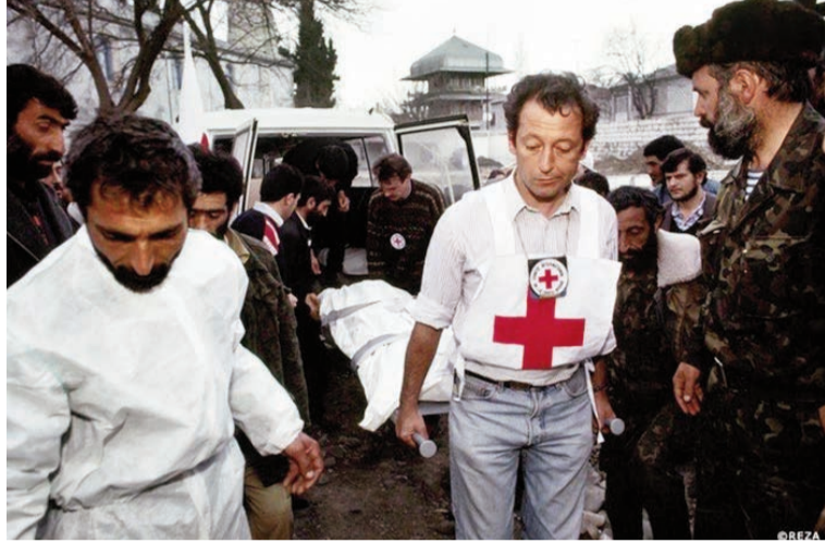
(Əvvəli 4-cü səhifədə)