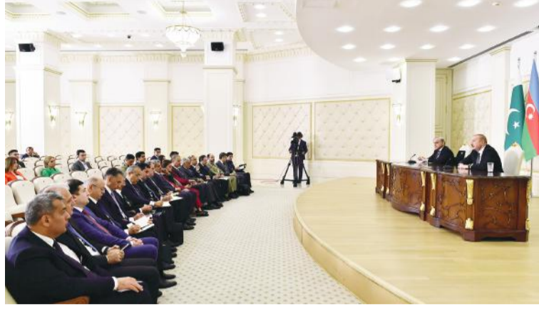
(Əvvəli 2-ci səhifədə)

Eyni zamanda, biz Şəhidlər xiyabanında da olduq. Orada bu ölkə uğrunda həyatını qurban verənlərin də ruhuna ehtiramımı bildirdim. Əziz Qardaşım, buraya gələndə yolboyu gördüklərim mənə çox dərin təəssürat yaradıb. Sizin gərgin əməyiniz və rəhbərliyiniz sayəsində ölkəmizdə böyük işlər görülüb. Mən İslamabadda qayıtmamışdan öncə Sizdən bir neçə xahiş edəcəyəm. Bizim şəhər planlaşdırılması və yaşllaşdırma sahəsində sizin təcrübənizə ehtiyacımız var. Şəhəriniz son dərəcə təmizdir, tullantıların emalı məsələsi, yəni, bu sahələrdə bizim sizin təcrübənizə ehtiyacımız var. Həqiqətən də, mən çox şadam və məmnunam ki, ölkəniz bu cür inkişaf edib.