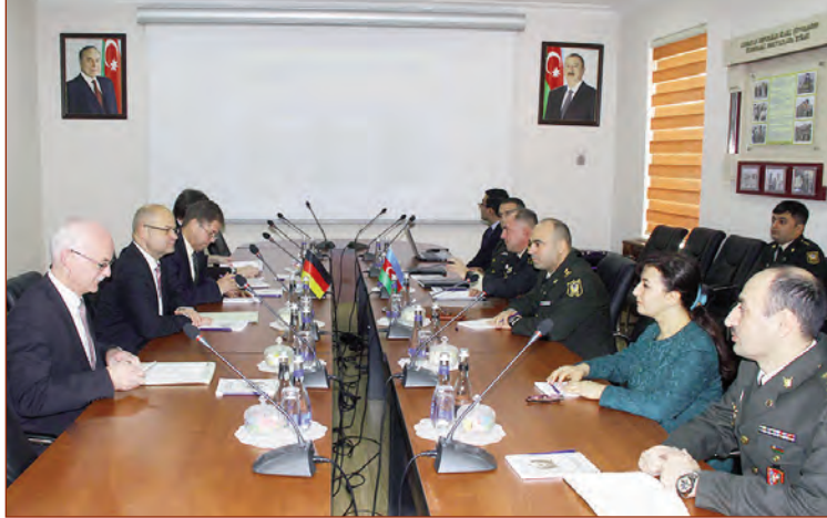
lərinin sosial-hüquqi müdafiəsinin xüsusiyyətləri, eləcə də bir sıra digər məsələlər müzakirə olunub.

Müdafiə Nazirliyi Mətbuat Xidmətinin məlumatına əsasən, tədbirdə hərbi qanunvericiliyə dair qarşılıqlı təcrübə mübadiləsi keçirilib, hərbi qulluqların və onların ailə üzv-