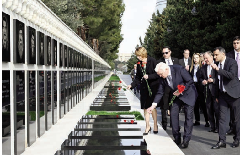
(Əvvəli 2-ci səhifədə)

Bizim üçün strateji mövzularda da müzakirə apardıq. Eyni zamanda, iqtisadi əməkdaşlıq perspektivlərimizi müzakirə etdik. Siz artıq bir neçə meyarı qeyd etdiniz. Bununla belə, 2022-ci ildə Azərbaycan Almaniyada böyük rol oynayıb. Rusiyadan aldığımız qaz təchizatında dayanma baş verdiyi zaman Azərbaycan üzərinə böyük məsuliyyət götürdü və mən buna görə Sizə çox təşəkkür edirəm. Sizin sözlərinizdən ələ başa düşdüm ki, burada qaz ilə yanaşı, infrastrukturun genişləndirilməsinə də ehtiyac var. Beləliklə, infrastrukturun yaxşılaşdırılması üzərində Avropada işləməliyik. Çünki o, hələ də kifayət həcmdə deyil. Bir sözlə, bu görüşlərdən sonra yeni ev tapşırıqlarımız da var.