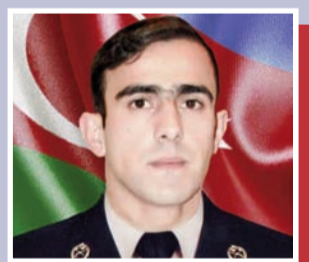
“Mən də tarix yazacam” demişdi...