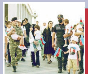
“Mənim atam qəhrəmandır” layihəsi çərçivəsində növbəti tədbir keçirilib