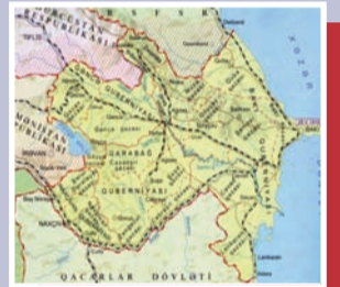
“Qarabağ və Şərqi Zəngəzur Azərbaycanıdır!”