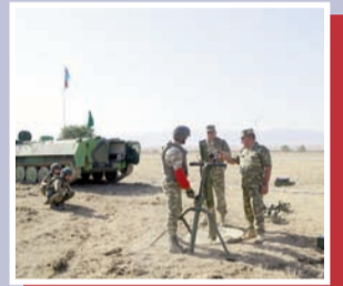
“Beynəlxalq Ordu Oyunları - 2021”