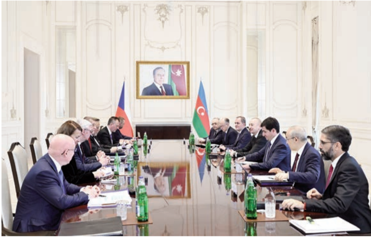
(Əvvəli 2-ci səhifədə)

Hər bir ölkə öz suverenliyini, ərazi bütövlüyünü və sərhədlərinin toxunulmazlığını müdafiə etməyə hazır olmalıdır