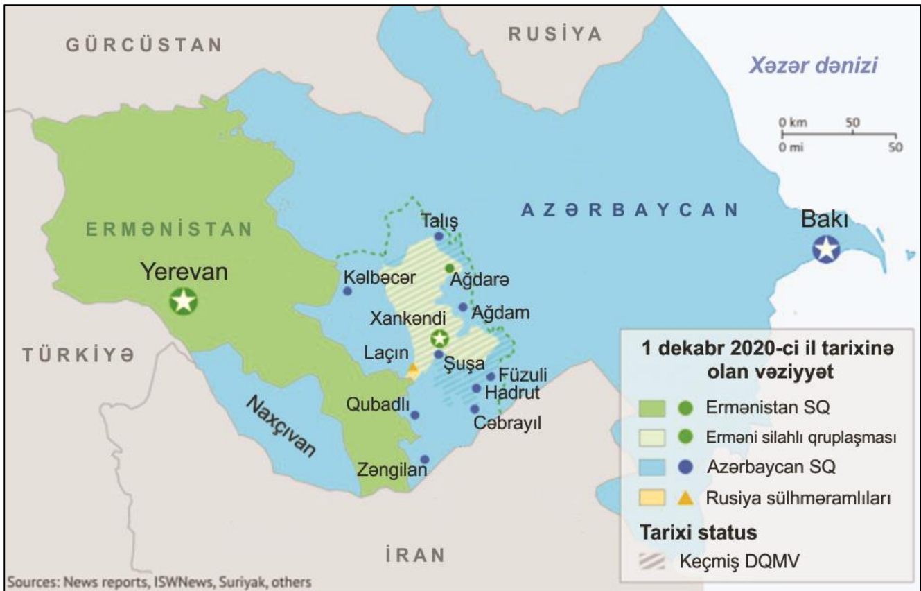
Şəkil 1. Qarabağ regionunun 1 dekabr 2020-ci il tarixinə olan siyasi xəritəsi [10]

habelə çoxsaylı artilleriya qurğularını, hava hücumundan müdafiə və raket sistemlərini, piyadaların döyüş maşınlarını itirdiyi məlum olmuşdur [12, s.11]. Bu, əsasən, pilotsuz uçuş aparatlarının (PUA) istifadəsi ilə qazanılan ilk müharibə idi. Hərbi analitik Uzi Rubinin dediyi kimi, “ pilotsuz uçuş aparatlarının ənənəvi quru qoşunlarını alt-üst etdiyi, onu zəiflətdiyi və Azərbaycanın Ordusunun hərəkətə keçməsinə və strateji səviyyəli kritik nöqtələrə nəzarət etməsinə yol açan ilk postmodern münaqişə... ” [12, s.5]. Bu, eyni zamanda Ermənistan REM sistemlərini susdurmaqla, onların sıradan çıxarılmasını və zenit-raket batareyalarının məhv edilməsini asanlaşdıran elektron müharibə idi. Bu müharibə İrəvanın “həm döyüş taktikası, həm şəxsi heyət, həm də büdcə” baxımından geri qaldığı, hücum PUA-ları tərəfindən hər bir hadisənin real vaxt rejimində lentə alındığı və ötürüldüyü əsl postmodern müharibə idi.