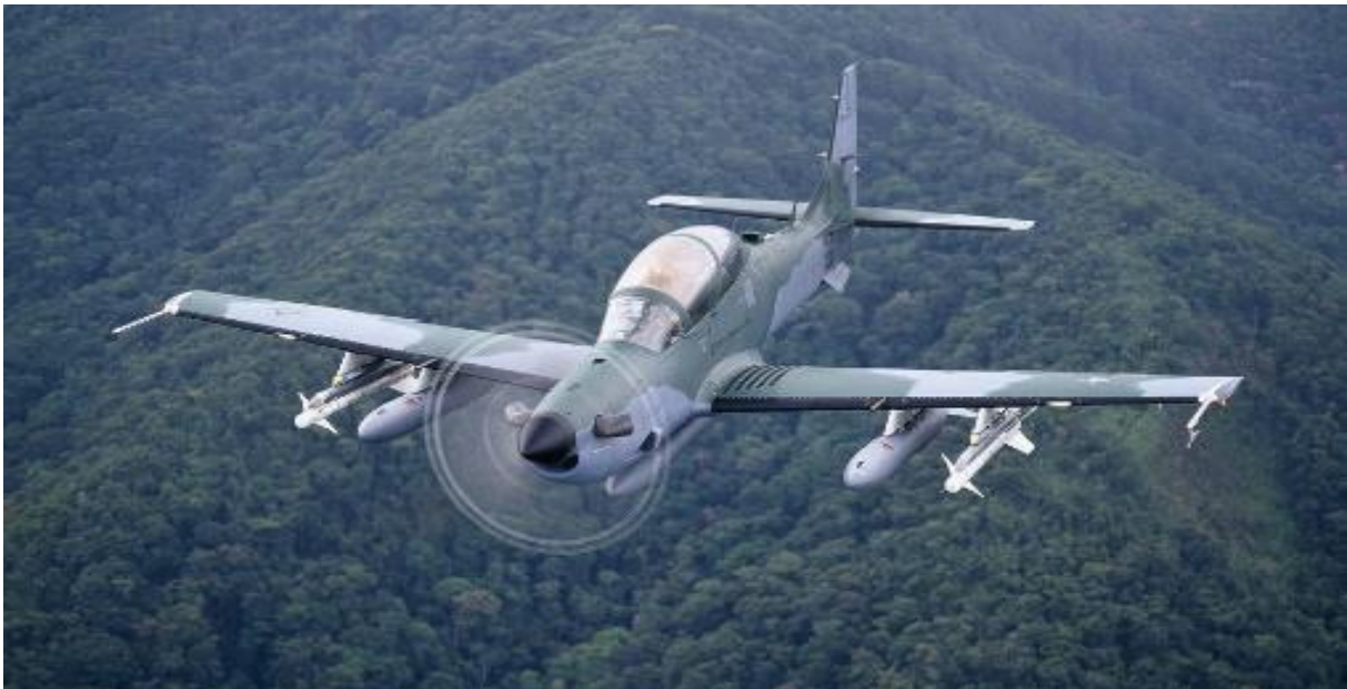
Şəkil 1. A-29 Super Tucano təyyarəsi

Başqa bir Turbovint mühərrikli yaxın hava dəstəyi təyyarəsi A-29 Super Tucanodur (Şəkil 1).