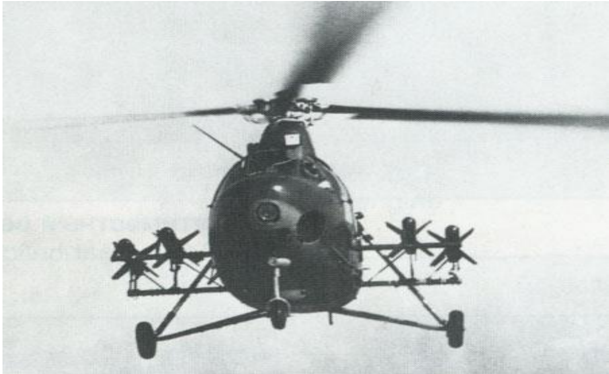
Şəkil 3. Mi-1 vertolyotu (1961 il)

Pərlərin dönməyə başladığı andan etibarən vertolyotlar insanlar üçün hər sahədə xidmət etməyə başladı. Yanğın söndürmə, nəqliyyat, kəşfiyyat, əyləncədən turizmə qədər müxtəlif tapşırıqların yerinə yetirilməsində tətbiq olunan vertolyotların “hücum” tapşırıqlarına diqqət yetirək. Ruslar tərəfindən istehsal olunan və ilk hücum tapşırıqlarını yerinə yetirən vertolyot kimi tarixə düşən Mi-1 vertolyotu (Şəkil 3) 1948-ci ildə ilk uçuşunu həyata keçirərək 1950-ci ildə silahlanmaya daxil oldu.