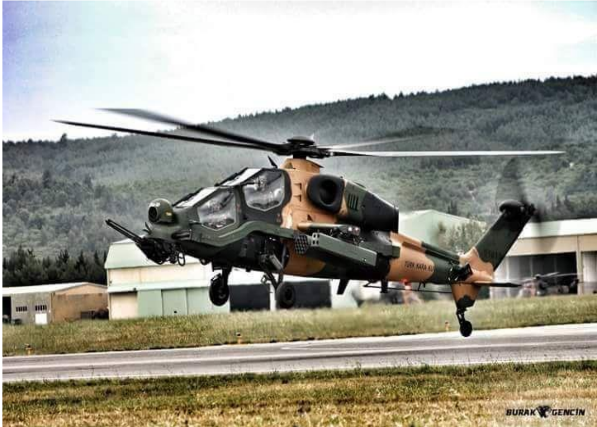
Şəkil 4. T-129 Atak vertolyotu

Yüksək atəş və manevr imkanları sayəsində quru qoşunlarına bilavasitə hava dəstəyi vermək üçün təyin olunan T-129 Atak vertolyotu (Şəkil 4), ilk növbədə Cirit və UMTAS/LUMTAS idarəolunan raketlərlə və AGM-114 Hellfire, BGM-71 TOW, Hydra 70, Spike-ER tipli tank əleyhinə idarəolunan raketləri tətbiq etmə imkanına malik olmaqla yanaşı, 20 mm-lik top silahını daşıyan Atak FLİR ilə eyni vaxtda işləyən ovçu kaskasına da malikdir. Kaskanı istifadə edən pilot hansı istiqamətə baxarsa FLİR də o istiqamətə dönmür və pilota daha rahat görüş və hədəfi izləmə imkanı verir. Meteksan, Atak üçün MİLDAR (müasir həssas hədəf aşkaretmə və müşahidə radarı) işləyib hazırlandı və testləri müvəffəqiyyətlə tamamlandı. AH-64 Longbow modeli üçün hazırlanan bu radar sistemi AH-64 Longbow-ya nəzərən texniki olaraq daha əlverişli və üstündür.