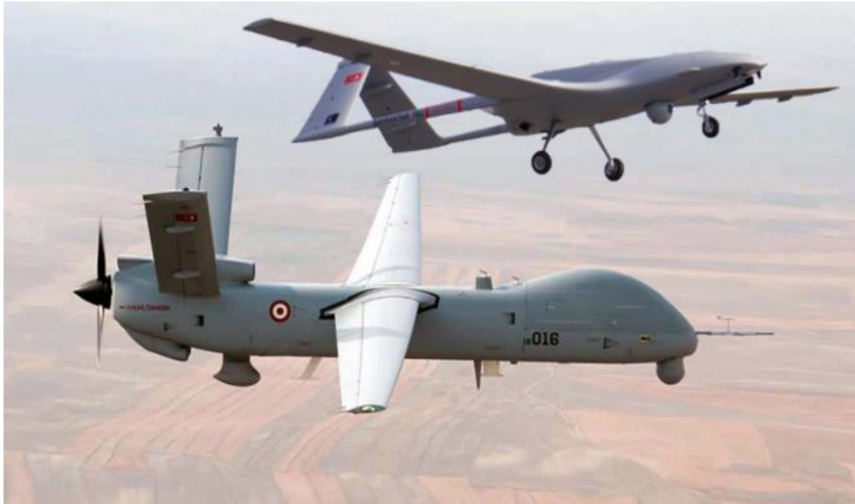
Şəkil 5. Anka-S və Bayraktar TB2 PUA-ları

Anka PUA-nın fərqli versiyaları mövcuddur. Bu versiyaların da özünəməxsus FLİR və naviqasiya sistemləri var. Məsələn, Anka-A-da SAR (Sintetik Açıqlı Radar) sistemləri olduğu halda Anka-B-də bu sistem yoxdur. Peyk idarəetmə və CATS FLİR sistemi ilə təchiz olunan Anka-S, Anka PUA-nın ən inkişaf etmiş versiyalarından biridir (Şəkil 5). Hazırda Anka PUA-nın silahlı versiyası kimi seçilən modeli Anka-A modelidir. Lakin yaxın zamanlarda Anka-S PUA-nın silahlı versiyasının da atışları həyata keçiriləcəkdir. Anka layihələrindən əldə olunan təcrübə sayəsində 1000 kq-a qədər faydalı yük tutumuna malik və uçuş tavanı 15 km-ə qədər olan silahlı Akıncı PUA-nın istehsalı istiqamətində aparılan işlər artıq yekunlaşmış, aparılan test yoxlamaları uğurla nəticələnmişdir. Peyk idarəetməli və SAR radarı olacaq bu layihə PUA sahəsində əldə olunan ən yüksək nailiyyət hesab olunur [6, s.4].