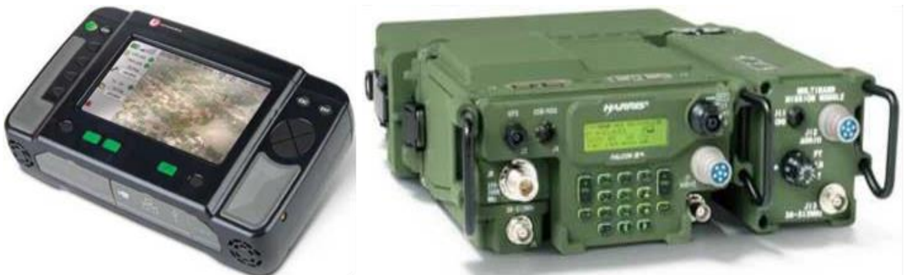
Şəkil 6. Rover 5 və AN/PRC-117 rabitə vasitəsi

L-3 Communications firması tərəfindən işlənib hazırlanan əldə daşına bilər Rover 5 (Şəkil 6) cihazı ilə Harris RF Communications firması tərəfindən işlənib hazırlanan AN/PRC-117 modeli rabitə vasitəsi ilə birlikdə istifadə edildikdə havada kəşfiyyat aparən təyyarə (vertolyot) və ya PUA-dan göndərilən məlumatların qəbul edilməsi və eyni zamanda ümumqoşun bölmələrinin işarələdikləri hədəfləri həmin anda təyyarə (vertolyot) kabinəsinə ötürülməsini təmin etmək imkanına malikdir [7, s.2-3].