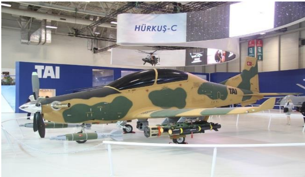
Şəkil 2. Hürkuş-C təyyarəsi

Dünyanın ən güclü orduları sırasında yer alan qardaş Türkiyənin yaxın hava dəstəyində Müdafiə Sənayesinin təlim təyyarəsi olaraq başladığı “Hürkuş” layihəsinin bir başqa variantını inkişaf etdirərək Hürkuş-C (Şəkil 2), yəni yaxın hava dəstəyi tapşırıqlarını yerinə yetirə bilmə imkanına malik təyyarə modelini yaratması oldu. Bu təyyarədə qanad altında olmaqla dörd ədəd Cirit PODu, UMTAS və LUMTAS markalı zireh deşici raketlər, GBU-12 markalı lazer özü yönələn aviasiya bombası, raket sistemi, MK-81 və 82 ümumi məqsədli bombaları, MK-106 və BDU-33 markalı mini bombalar, HGK-3 və KGK-82 idarə olunan aviasiya bombaları daşıya bilər. Təyyarəyə asma vəziyyətində 12.7 mm və ya 20 mm pulemyot quraşdırıla bilər. FLİR sistemi kimi Aselsan firmasının istehsal etdiyi elektron-optik kəşfiyyat, müşahidə və hədəfgöstərmə sistemi olan AselFLİR 300T istifadə edən Hürkuş-C-nin bu yaxınlarda CATS sistemindən istifadə etməsi də gözlənilir. AselFLİR 300T elektron-optik kəşfiyyat, müşahidə və hədəfgöstərmə sistemini istifadə edən “Anka” PUA-ları və T-129 Hücümçü təyyarələrinə də CATS sistemlərinin quraşdırılması planlaşdırılır [6, s.2].