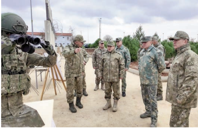
Nazirliyindən AZƏRTAC-a bildirilib ki, Azərbaycan nümayəndə heyəti Türkiyə ordusunun Suriya ilə

sərhəddəki postlarından birində də olub.