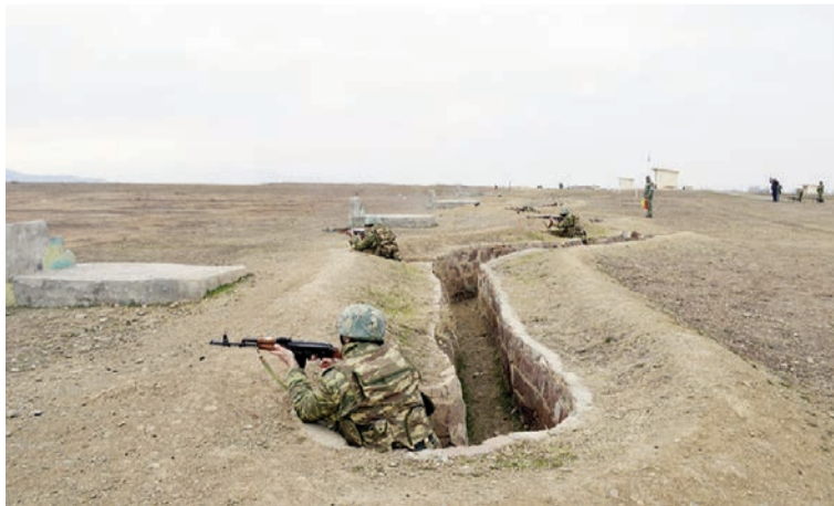
(Əvvəli 1-ci səhifədə)

Məşğələlər tibb hazırlığı üzrə şəxsi heyətin maarifləndirilməsi və fəaliyyətlər zamanı ilkin tibbi yardımın düz-