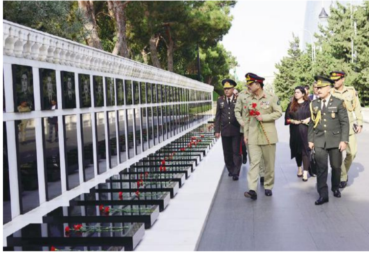
zin müstəqilliyi və ərazi bütövlüyü uğrunda şəhid olan Sonra Müdafiə Nazirliyində təntənəli qarşılaşma məra-

Müdafiə Nazirliyi Mətbuat Xidməti xəbər verir ki, görüşdən əvvəl Pakistan nüma-