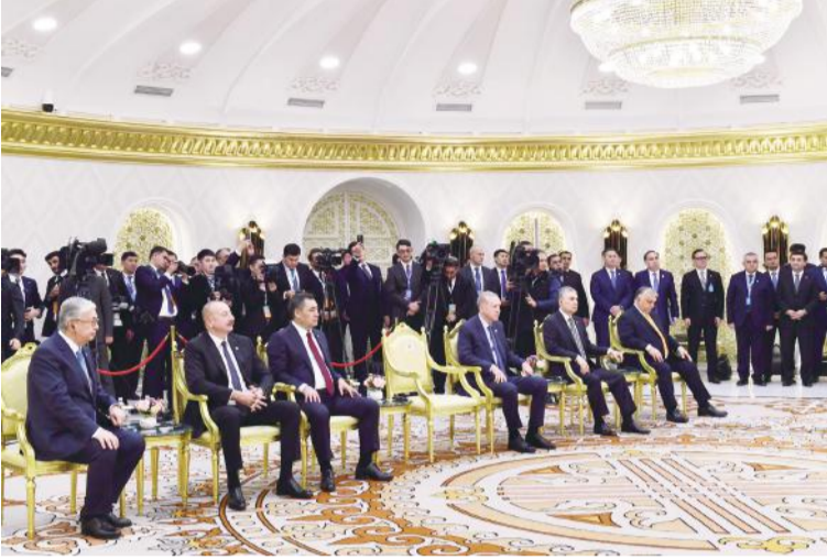
(Əvvəli 2-ci səhifədə)

Bildiyiniz kimi, 30 ilə yaxın müddət ərzində Ermənistan Azərbaycan torpaqlarını işğal altında saxlamış və burada qeyri-qanuni qondarma rejim yaratmışdı. Ermənistan tərəfindən həyata keçirilmiş etnik təmizləmə nəticəsində bir milyondan artıq azərbaycanlı öz dədə-baba yurdlarından qovulmuşdur. Ermənistan şəhər və kəndlərimizi yerlə-yeksan etmiş, tarixi və dini abidələrimizi dağıtmış və təhqir etmişdir.