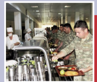
Bölmələrdə ən müasir səviyyədə sosial şərait yaradılıb