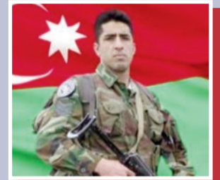
Vətənə bağlılıq səadəti