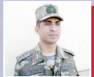
“Arzumuzu qovuşduq, yurdumuzu azad gördük”