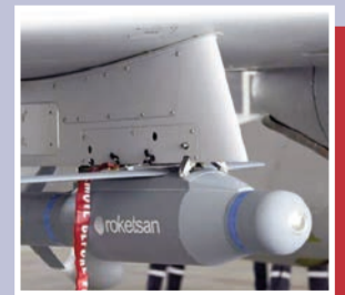
“Bayraktar”lar üçün müasir döyüş sursatları