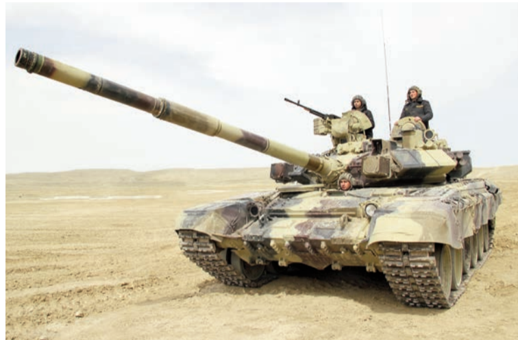
(Əvvəli 1-ci səhifədə)

Əsl qəhrəmanlıq nümunəsi göstərərək Qələbəyə gedən yola dəmirdən atlarımızla iz saldıq.