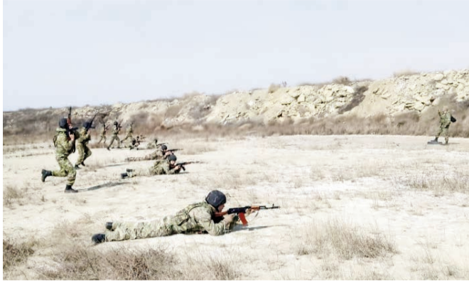
Türkiyə Respublikasının İzmir şəhərində keçirilən

göstərişinə əsasən, Azərbaycan Ordusunda şəxsi heyətin peşəkarlıq səviyyəsinin artırılması istiqamətində görülən işlər davam etdirilir. Bu çərçivədə Azərbaycan Ordusunun hərbi qulluqçuları