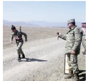
Himni səsləndirilib. Qoşun növlərini və bir-

Əvvəlcə ümummilli lider Heydər Əliyevin və ölkəmizin müstəqilliyi, ərazi bütövlüyü uğrunda şəhid olanların xatirəsi bir dəqiqəlik sükutla yad edilib, Azərbaycan Respublikasının Dövlət