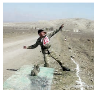
ləşmələri təmsil edən 12 komanda birincilik uğrunda

mübarizə aparıb. Hərbi qulluqçular atış, qumbaraatma və kross qaçışı üzrə yarışlarda güclərini sinayıblar.