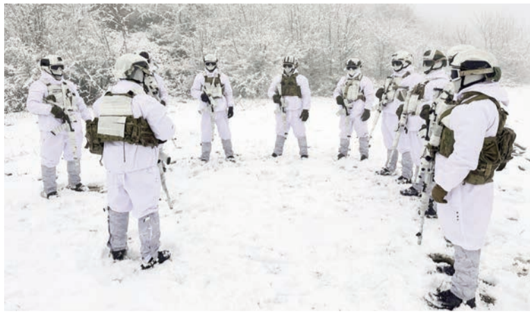
(Əvvəlki 1-ci səhifədə)

İcra olunacaq fəaliyyətlər dəqiqləşdirildikdən sonra ərazinin kəşfi aparıldı, planlaşdırılmaya uyğun olaraq görüləcək fəaliyyətlər dəqiqləşdirildi. Təlimin növbəti fazasında isə əldə olunan məlumata əsasən, şərti düşmənin törədəcəyi təxribatın qarşısını almaq, terrorçu qruplaşmaya zərər vurmaq, onları ələ keçirmək və qarşıya qoyulan digər tapşırıqlar icra olundu. Mobil qruplar sərt iqlim şəraitində, meşə və dağlıq ərazilərdə qarşıya qoyulmuş normativə uyğun təyin edilmiş istiqamətdə irəliləyərək pusqunu dəf etdilər. Təlimin digər ssenarisinə əsasən, ötürülmüş kəşfiyyət