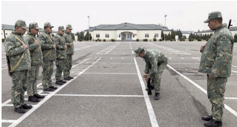
(Əvvəli 1-ci səhifədə)

Yüksək nizam-intizamı olan hərbi qulluqçunun döyüş vərdişlərinin yüksək olması da gözləniləndir.