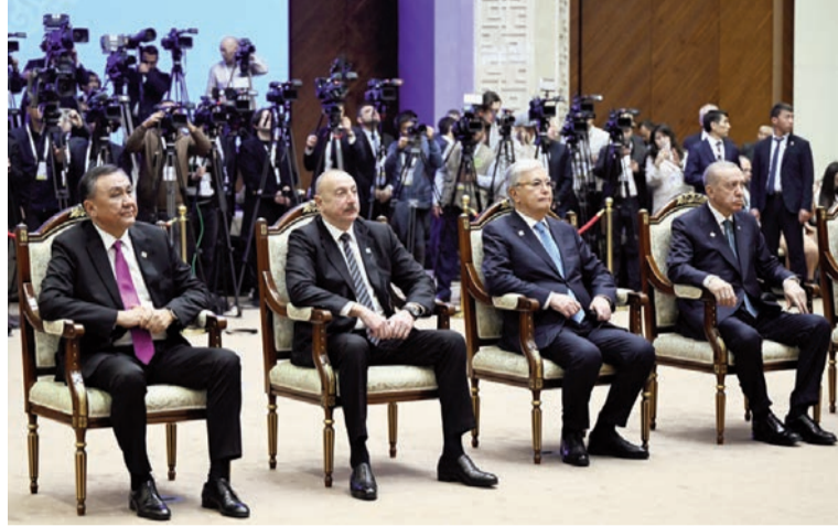
(Əvvəli 4-cü səhifədə)

Noyabrın 5-də Qırğızıstanın paytaxtı Bişkekde Türk Dövlətləri Təşkilatı (TDT) Dövlət Başçıları 11-ci Zirvə görüşündə iştirak edən dövlət və hökumət başçıları qeyri-rəsmi şam yeməyi olub.