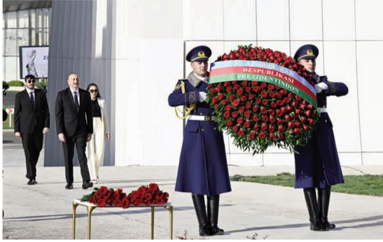
(Əvvəli 1-ci səhifədə)

Azərbaycan xalqı yaxşı xatırlayır, böyük dövlətlər, bu məsələni - Ermənistan-Azərbaycan münaqişəsini guya həll etməyə çalışan vasitəçilər dəfələrlə bəyan edirdilər ki, bu münaqişənin hərbi həlli yoxdur. Nəyi demək istəyirdilər Azərbaycan xalqına? Onu demək istəyirdilər ki, biz bu işğalla barışaq. Çünki onların planlarında məhz bu idi. Onların planlarında məsələni həll etmək yox, işğala son qoymaq yox, Azərbaycan torpaqlarını erməni işğalının altında əbədi saxlamaq idi. Biz bunu görürdük, bilirdik. İllər keçdikcə, hər bir danışıqlar dövrü uğursuzluqla başa çatdıqca həm Azərbaycan rəhbərliyi, həm Azərbaycan xalqı bunu əyani şəkildə görürdü. Biz isə bu vəziyyətlə barışa bilməzdik. Hələ 2003-cü ildə ilk dəfə Azərbaycan Respublikasının Prezidenti vəzifəsinə seçildə mən bəyan etmişdim ki, nəyin bahasına olursa-olsun, biz öz ərazi bütövlüyümüzü bərpa edəcəyik, Azərbaycanın ərazi bütövlüyü, suverenliyi danışıqlar mövzusu olmayacaq və həyat bunu göstərdi.