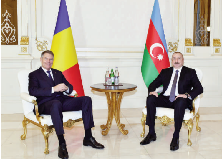
(Əvvəlki 1-ci səhifədə)