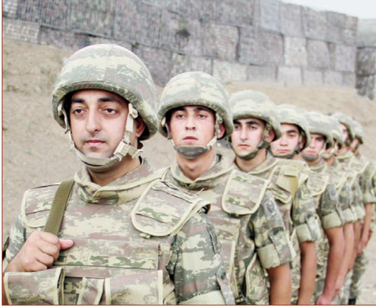
(Əvvəli 4-cü səhifədə)