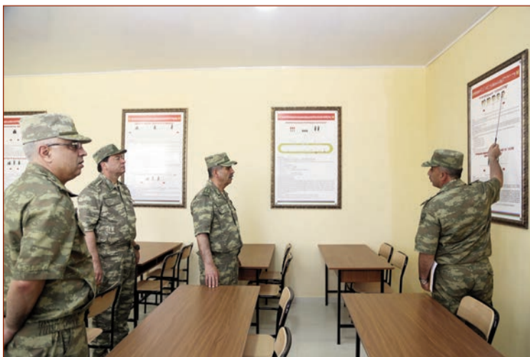
İyunun 7-də Müdafiə Nazirliyinin rəhbərliyi yeni istifadəyə verilən Snayper hazırlığı mərkəzində olub.