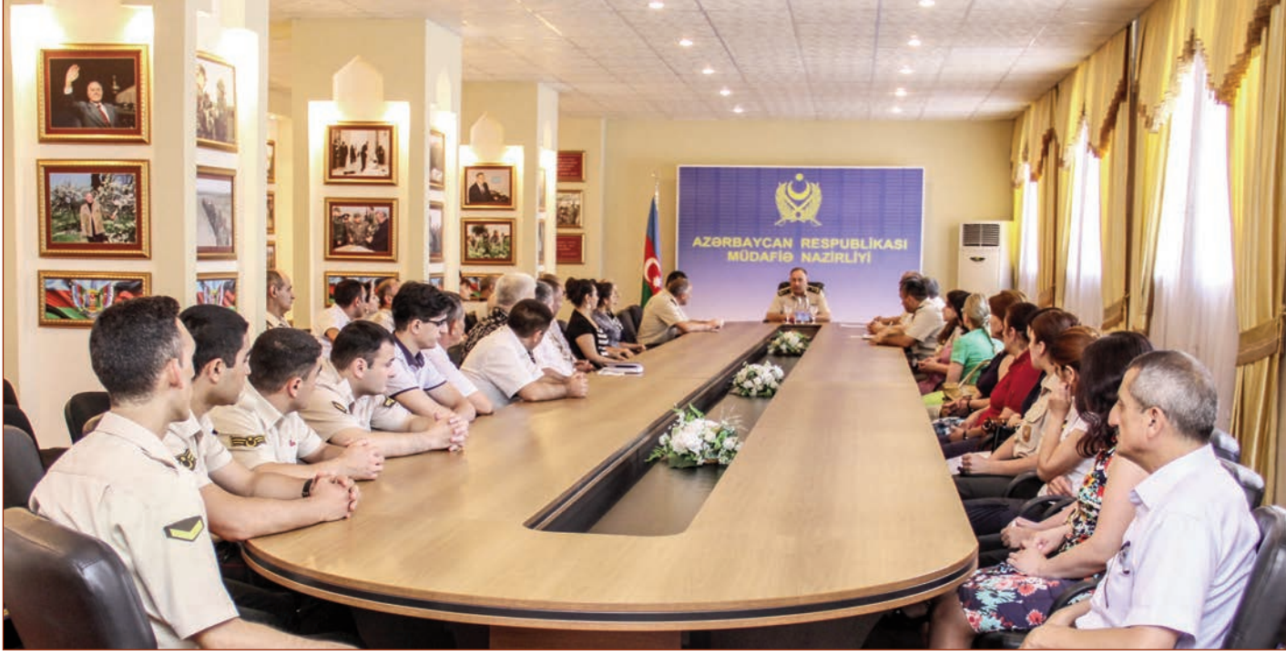
Nazir müavini Silahlı Qüvvələrimizdə aparılan islahat-