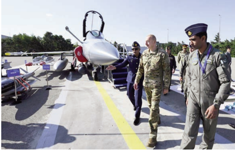
(Əvvəli 2-ci səhifədə)