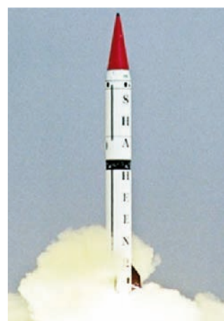
Pakistan istehsalı olan "Xatf-4" adı altında tanınan

"Şahin-1A" taktiki-operativ ballistik raketini özündə orta məsafəli qatıyanacaq ballistik raketini təsvir edir. "Şahin-1" nəslindən olan raketlərin hazırlanmasına 1995-ci ildən başlanılıb. Raketin ilk sınağı 1999-cu ildə həyata keçirilib. Pakistan ordusunun silahlanmasında bir neçə bu tipli raket kompleksi mobil qurğular üzərində yerləşdirilib. 1999-cu ilin aprelində Ormain hərbi