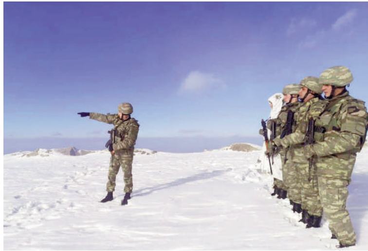
(Əvvəlki 1-ci səhifədə)

Riyazi elmlərdə belə bir termin işlənir - aksiom. İlk dəfə qədim yunan filosofu Aristotelin işlətdiyi aksiom sübutsuz qəbul edilən fikir, ümumiyyətlə, dəlilə, sübuta ehtiyacı olmayan həqiqətdir. Zabitin ordumuzun təminatı, əsgərlərin xidməti, yüksək döyüş ruhu haqqında dediyi fikirlər də bu gün bütün cəmiyyətimiz üçün bir aksiomdur. Çünki əsgər və zabitlərimiz haqqında deyilən bütün müsbət fikirlər döyüş meydanında, Vətənin dar günündə təsdiqini tapıb. Azərbaycan əsgərinin İkinci Qarabağ müharibəsindəki şanlı qələbəsi, müharibədən sonra azad olunmuş ərazilərimizdə inamlı xidməti, qarşı tərəfin çox sayda təxribatlarının qarşısının uğurla alınması... və icra olunan digər xidmətlər artıq bütün dünyaya bu aksioma-