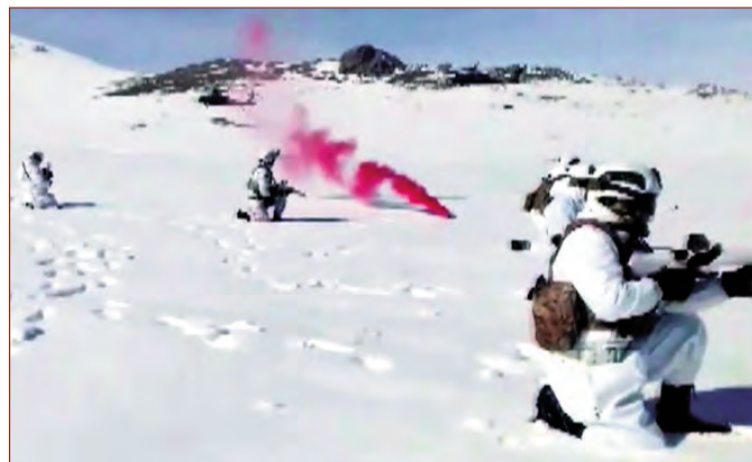
Türkiyə Respublikasının Qars şəhərində keçirilən beynəlxalq "Qış təlimi-2019"da hərbi qulluqçularımızın iştirakı davam edir.

Baş leytenant Ruslan HƏSƏNZADƏ, "Azərbaycan Ordusu"