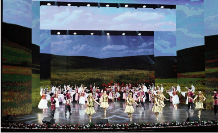
(Əvvəli 1-ci səhifədə)

Qazaxıstan, Qırğızıstan və Özbəkistan ilə fəal şəkildə investisiya layihələri həyata keçirilir. Artıq Azərbaycan-Qazaxıstan, Azərbaycan-Qırğızıstan və Azərbaycan-Özbəkistan birgə investisiya fondları yaradılıb.