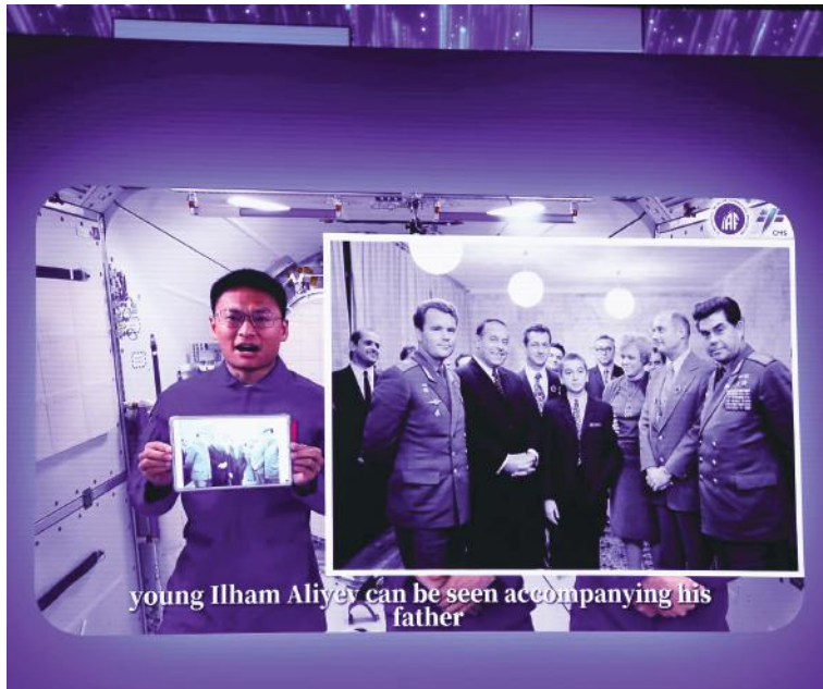
young Ilham Aliyev can be seen accompanying his father

Hesab edirəm ki, dünyanın hər bir ölkəsi üçün coğrafi yerləşmə böyük əhəmiyyət kəsb edir. Bizim üçün isə coğrafiya firsət deməkdir. Əsrlər boyu birgə yaşayış və tərəfdaşlıq tarixinə malik qonşularımız ilə yaxşı münasibətlər sayəsində biz coğrafi yerləşməyimizi müsbət sənariyə çevirə bilmişik. Bu gün biz üfqlərimizi genişləndiririk. Bu mühüm beynəlxalq tədbirin keçirilməsinin bizə həvalə olunmasını ölkəmizə