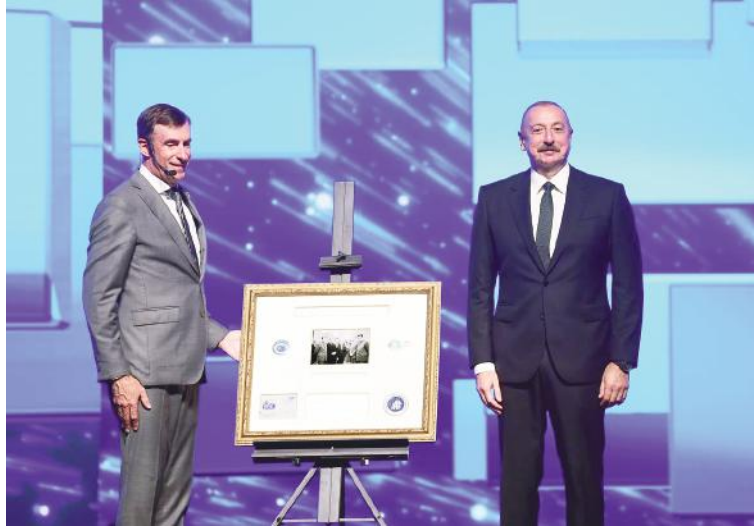
(Əvvəlki 2-ci səhifədə)

Azərbaycan on ildən çoxdur ki, Bakı Prosesinin təşəbbüskarıdır. Tarixdə ilk dəfə idi ki, Avropa Şurası və İslam Əməkdaşlığı Təşkilatı vahid platforma çərçivəsində bir araya gətirildi və burada global siyasət, mədəniyyətlərarası dialoq və dinc inkişafa dair vacib məsələlər müzakirə edildi.