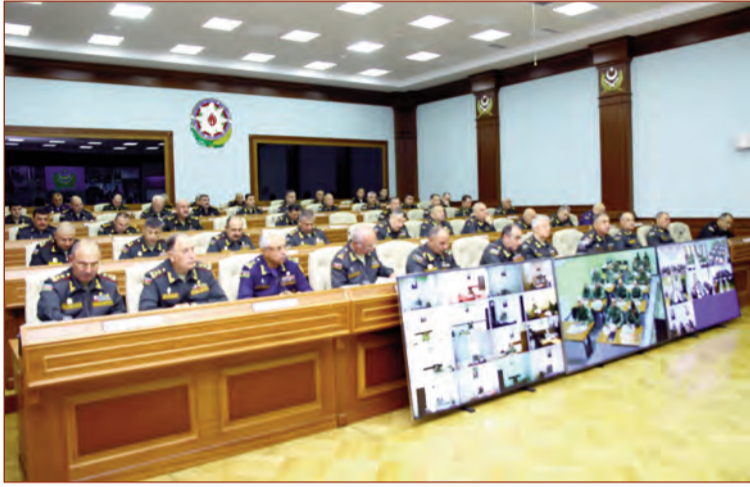
Azərbaycan Respublikasının Prezidenti, Ali Baş Komandan İlham Əliyevin Azərbaycan Ordusu qarşısında

Sentyabrın 29-da Müdafiə naziri general-polkovnik Zakir Həsənov Mərkəzi Komanda Məntəqəsində Azərbaycan Ordusunun rəhbərliyi, eləcə də videobağlantı vasitəsilə cəbhə bölgəsində yerləşən birləşmə komandirlərinin və digər məsul zabitlərin cəlb olunması ilə geniş tərkibdə xidməti müşavirə keçirib.