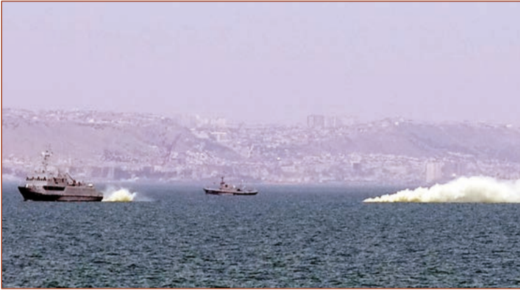
Silahlı Qüvvələrin 2016-cı il üçün hazırlıq planına uyğun olaraq, iyunun 19-dan başlanan operativ-taktiki təlimlər davam edir.

Yüksək döyüşə hazırlıma səviyyəsinə gətirilən idarəetmə orqanları və qoşunlar mü-təşəkkil və planlı qaydada yenidən qruplaşmanı həyata keçirərək cəmləşmə rayonlarına çıxarılır, aerodromlarda aviasiyanın, dənizdə isə gəmilərin dislokasiya yerləri dəyişdirilir.