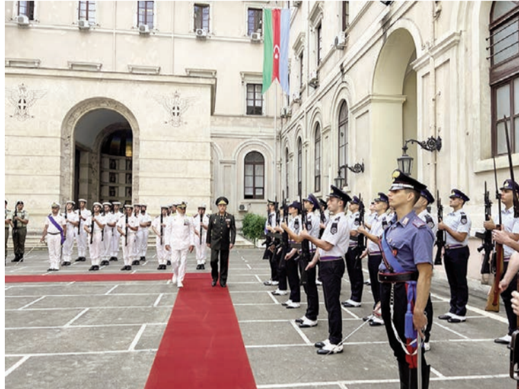
sunun Baş Qərargah rəisi İtaliya Respublikası Silahlı Qüvvələrinin

fövqəladə və səlahiyyətli səfəri cənab Rəşad Aslanovun da iştirak etdiyi görüşdə İtaliya Müdafiə Nazirliyi və Silahlı Qüvvələrinin strukturu, fəaliyyət istiqamətləri ilə bağlı brifinq təqdim olunub.