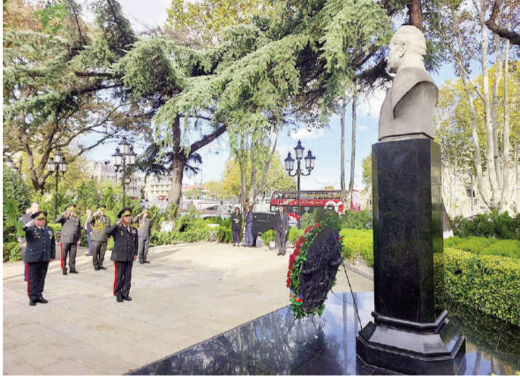
Noyabrın 14-də Azərbaycan Respublikasının müdafiə naziri general-polkovnik Zakir Həsənov Gürcüstanın müdafiə naziri cənab Cuanşer Burçuladzenin dəvətilə bu ölkəyə rəsmi səfər edib.