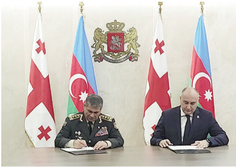
Görüşdə, həmçinin hərbi, hərbi-texniki, hərbi-təhsil, hərbi-tibb sahələrində əməkdaşlığın daha da genişləndirilməsi və qarşılıqlı marağ doğuran digər məsələlər müzakirə edilib.

Tərəflər regional təhlükəsizlik, hərbi əməkdaşlığın inkişaf perspektivləri, birgə hərbi təlimlərin keçirilməsi və işçi görüşlərin təşkili barədə ətraflı fikir mübadiləsi aparıblar.