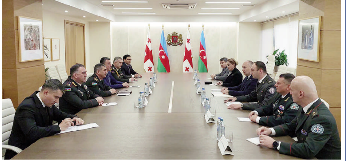
Gürcüstan Müdafiə Nazirliyində rəsmi qarşılama mərasimi təşkil edilib. Protokola uyğun olaraq, müdafiə naziri general-polkovnik Zakir Həsənov noyabrın 14-də Gürcüstanın Baş naziri cənab İrakli Qaribaşvili ilə görüşüb.