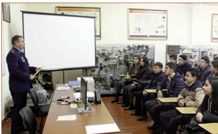
Müdafiə Nazirliyi Mətbuat Xidmətinin məlumatına əsasən, Bakının 72 nömrəli tam

Azərbaycan milli mücadiləsinin bütün fəalları, dövrün qabaqcıl ictimai-siyasi qüvvələri, sadə xalq kütlələri S.Mehmandarova böyük hörmət və ehtiram bəsləyirdilər. S.Mehmandarovun iştirak etdiyi bütün tədbirlərdə o, diqqət mərkəzində olardı və bu barədə dövrün qəzetlərində də xeyli məlumatlar vardır. Bayram günlərində keçirilən paradlarda S.Mehmandarovun iştirakı mətbuat səhifələrində xüsusi olaraq vəsf olunurdu. S.Mehmandarov milli ordunun simvoluna çevrilmişdi və milli ordu quruculuğu da haqlı olaraq onun adı ilə bağlı idi. Azərbaycanın milli-azadlıq mübarizəsinin öncüllərindən olan M.Ə.Rəsulzadə, F.X.Xoyski, Nağı bəy Şeyxzamanlı və digərləri çıxışlarında, əsərlərində və