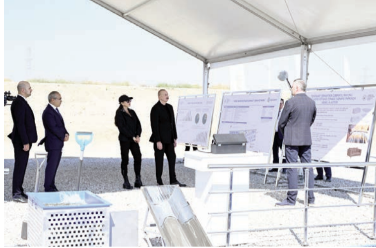
(Əvvəli 2-ci səhifədə)