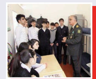
“Hər zaman yurdumuza, millətimize bağlı olmalıyıq”