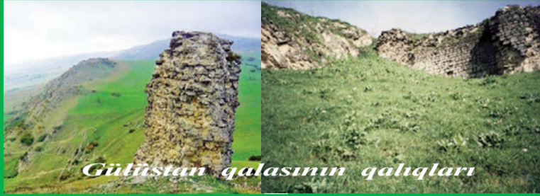
Gülüstan qalasının qalıqları

çisi Təbərinin məlumatına görə 733-734-cü illərdə Müslüm ibn Əbd əl-Məlik Şirvana hücum edərkən "Qaleyi Duxteran"ı (Qız qalası. Yerli sakinlər Gülüstan qalasına Qız qalası da deyirlər) tutaraq dağıdıb. Şirvanşahlar tərəfindən bərpa edilən Gülüstan qalası 1123-cü ildə Səlcuq sultanı Mahmud (1118-1131) tərəfindən yenidən dağıdılıb. Bir qədər sonra qala Şirvanşah II Məniçöhrün (1120-1149) bacısı Şahbanu tərəfindən bərpa edilib.