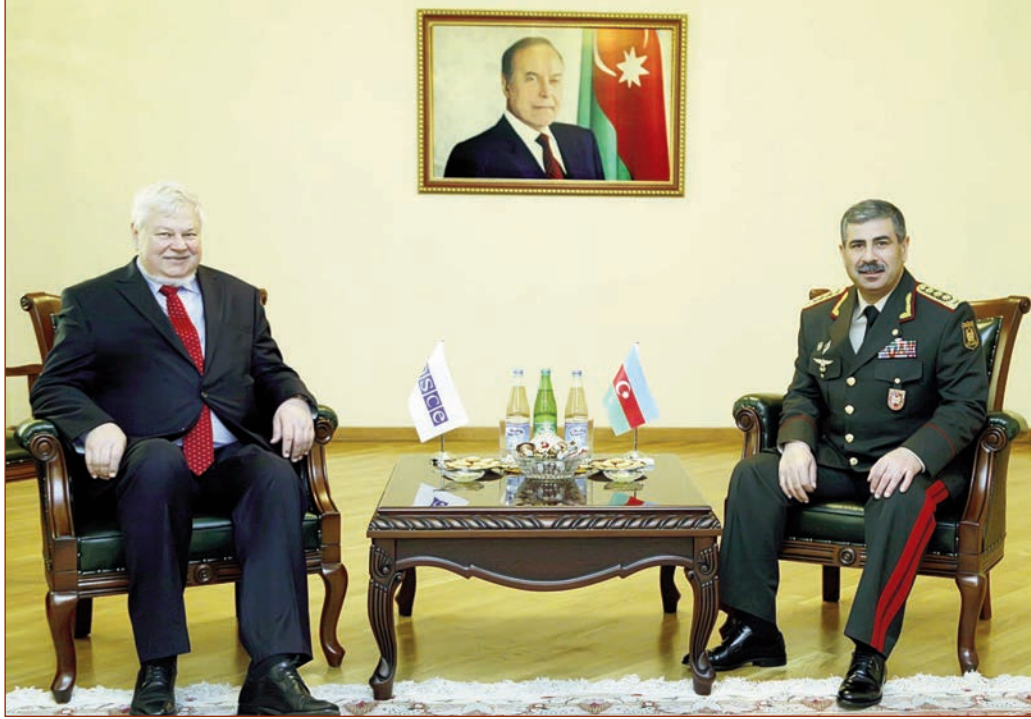
Aprelin 22-də Azərbaycan Respublikasının Müdafiə naziri general-polkovnik Zakir Həsənov ATƏT-in fəaliyyətdə olan sədrinin şəxsi nümayəndəsi Anjey Kasprşik ilə görüşüb.

Müdafiə naziri Ermənistan tərəfindən ərazilərimizin işğal edilməsi, rəsmi Yerevanın sülh danışıqlarından boyun qaçıraraq cəbhədə vəziyyəti gərginləşdirməsi və son vaxtlar uğursuzluğa düşər olaraq çoxsaylı itkilərə məruz qalan düşmənin minaatanlardan, iriçaplı silahlardan istifadə etməklə yaşayış məntəqələrini, qeyri-hərbi obyektləri və dinc sakinləri atəşə tutmaları faktlarını bir daha qonağın diqqətinə çatdırıb.