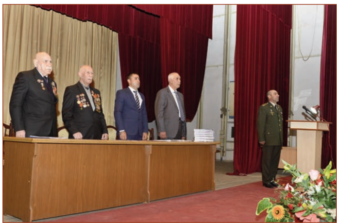
Bu günlərdə Naxçıvan Qarnizonunun Zabıtlar Evinə Hitler faşizmi üzərində Qələbənin 70 illiyi ilə əlaqədar olaraq müharibə veteranları ilə hərbi qulluqçuların görüşü keçirilib.