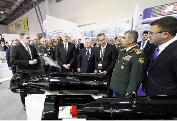
(Əvvəli 4-cü səhifədə)

Türkiyənin müdafiə sənayesini sərgidə təmsil edən daha bir şirkət isə "Turkish Aerospace"dir. "Turkish Aerospace" sabit və hərəkətli hava platformalarından pilotsuz uçuş aparatı və peyklərə qədər inteqrasiya olunmuş aerokosmik sistemlərin dizaynı, işlənilib hazırlanması, müasirləşdirilməsi, istehsalı, inteqrasiyası və istifadəsinə dəstək sahəsində Türkiyənin texnologiya mərkəzidir. Aerokosmik və müdafiə sahəsində ən yaxşı yüz global şirkət arasında yer alan "Turkish Aerospace" tərəfindən dizayn və istehsal edilən bütün məhsullar üçün inteqrasiya olunmuş logistika xidməti də göstərilir.