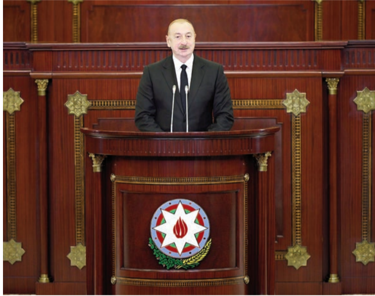
(Əvvəlki 1-ci səhifədə)