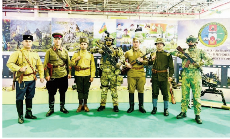
(Əvvəli 4-cü səhifədə)

Sərgidə həm də Azərbaycan Hərb Tarixi Muzeyi "Zəfərimiz - Anbaan!" ekspozisiyası ilə iştirak etdi. İştirakçılar tərəfindən böyük maraqla qarşılanan bu ekspozisiya 44 günlük Vətən müharibəsində Azərbaycan Ordusunun şanlı qələbəsinə həsr edilmişdi. Vətən müharibəsini və vətənpərvərliyi tərənnüm edən rəsmlərdən ibarət olan əsas bölmə Azərbaycanlı rəssamların yağlı boya ilə Zəfərimizə həsr etdikləri əsərlərindən ibarət idi. "Şuşa zəfəri", "Şuşa döyüşündən bir an", "Qarabağ Azərbaycanıdır!", "Zəfər paradi" adlı kətan üzərində rəsmlər də sərgi iştirakçıları nı diqqətini cəlb etdi.