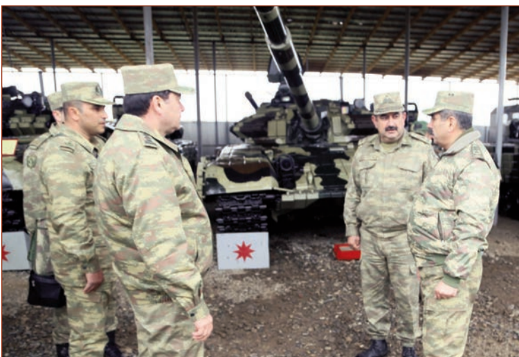
Müdafiə naziri general-polkovnik Zakir Həsənov Silahlı